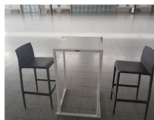
Set: Kubo Fero &amp; Pedralli