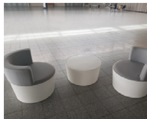
Set: Lounge Conic