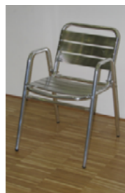
Bistrostuhl mit Armlehne