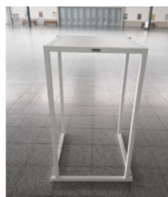
Stehtisch: Kubro Fero