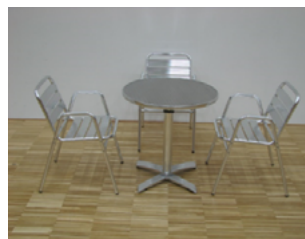
Set: Bistro, Aluminium