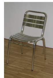
Bistrostuhl ohne Armlehne